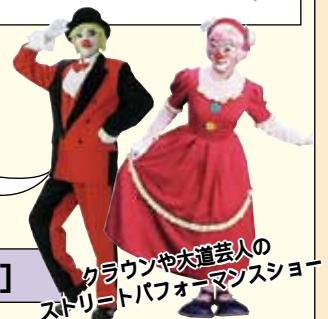
クラウンや大道芸人の ストリートパフォーマンスショー

問合せ...上里町役場企画財政課内記念事業事務局 [ ☎33-2421内221 ]